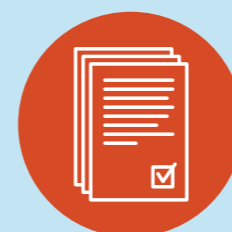
Osnova za donošenje odluke